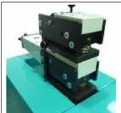
Som tilleggsutstyr kan maskinen utstyres med en tilleggsstasjon nr2