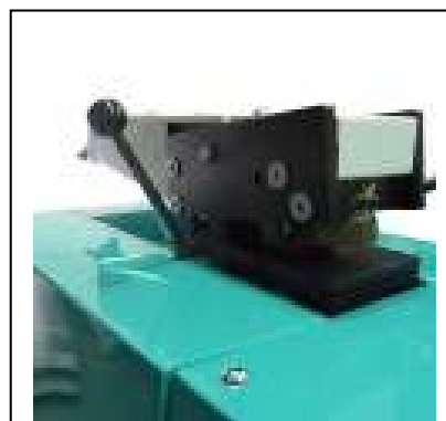
Toppen tiltes opp og tilbake for enkel frigjøring av profil ved hjelp av et håndtak.